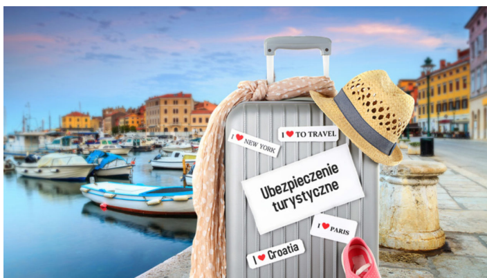
Ryc. 7 https://cromania.pl/ubezpieczenie-na-wyjazd-do-chorwacji