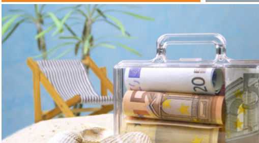
Ryc. 8 http://bbclearning.pl/wlasciwie-rozplanowac-wydatki-wakacje

Czyli ogranicza nas tylko wyobraźnia oraz stan konta