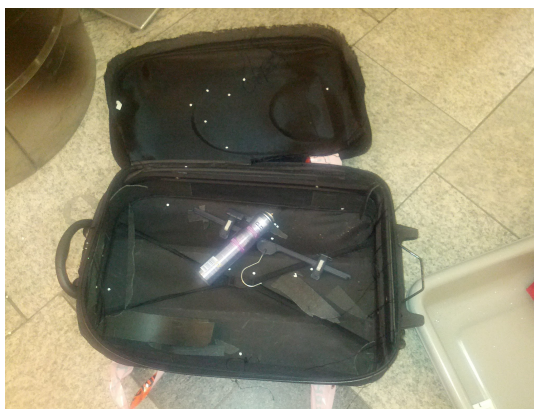
Ryc. 10 https://elmundodeunrubia.wordpress.com/2012/07/02/jeden-weekend-lufa-i-2-sic-zniszczone-walizki