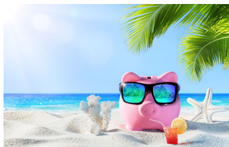
Ryc. 9 https://www.finance.egospodarka.pl/132594,Skad-wziac-pieniadze-na-wakacje-2016,1,60,1.html