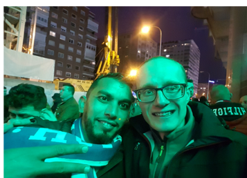
Ryc. 11 materiały własne