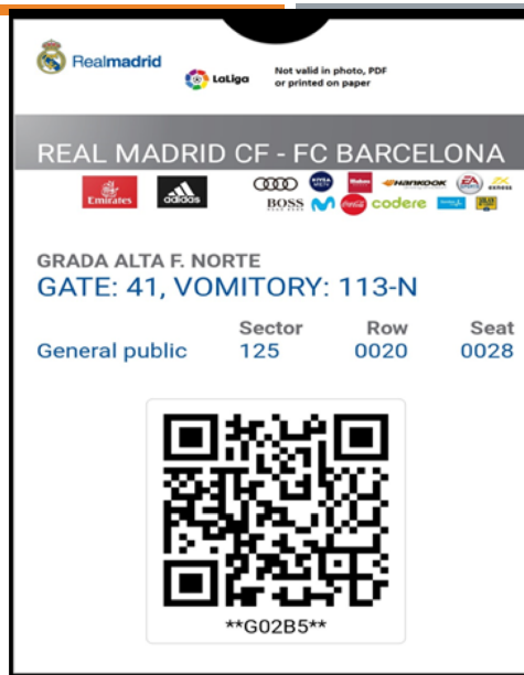
Ryc. 3 materiały własne