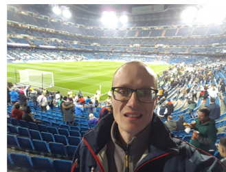
Ryc. 14 materiały własne

Ryc. 13 https://konkurskobietbiznesu.pl/firma/ecco