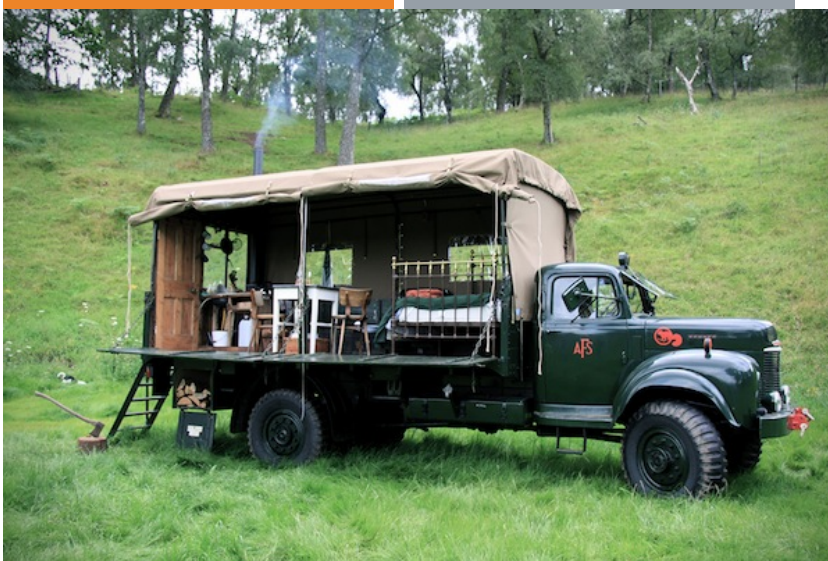
Ryc. 5

Czym się kierować przy wyborze miejsca do spania?