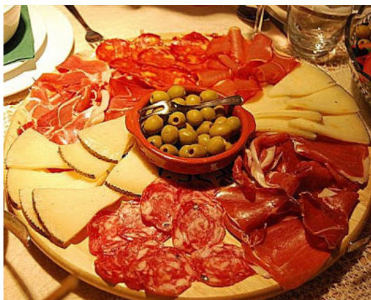
Ryc. 6 https://www.kuchennymidzwiemi.pl/hiszpanska-biesiada-rodzinny-klub-obiadowy